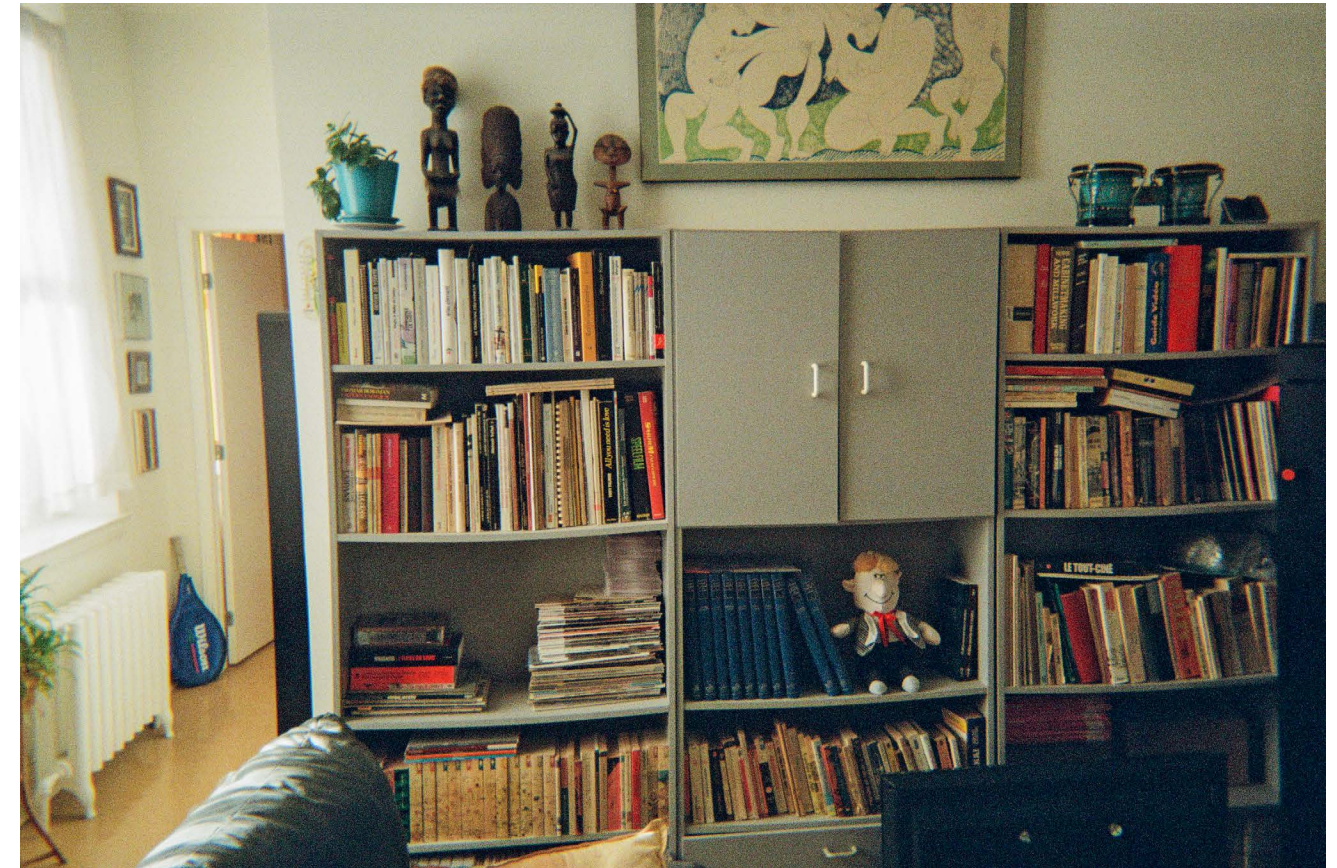
PHOTO DE MA BIBLIOTHÈQUE AVEC MES LIVRES qui RESSEMBLENT PARFOIS À DES AMIS ET AMIÈS