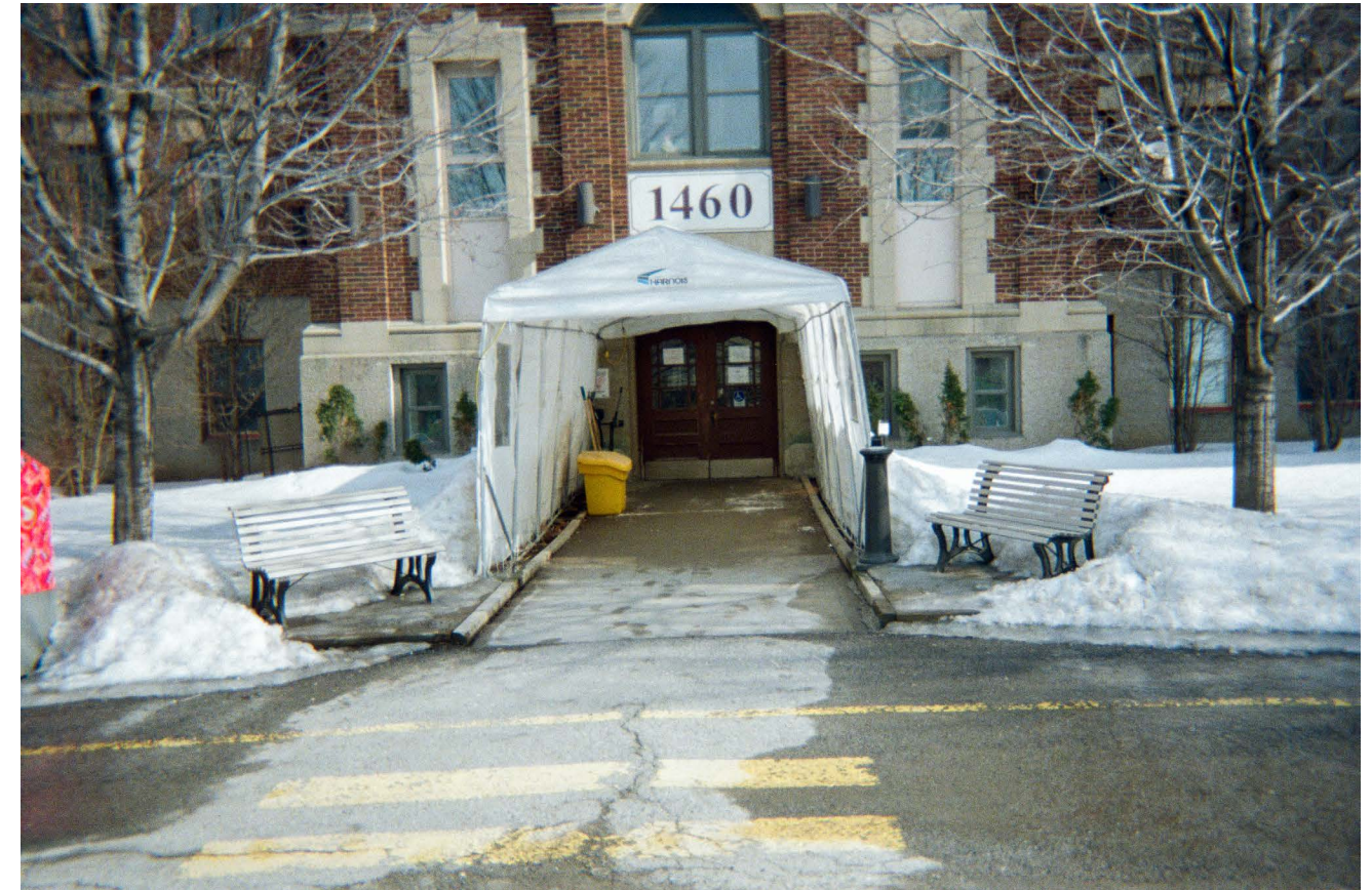
PHOTO 1 - DEVANT 1460