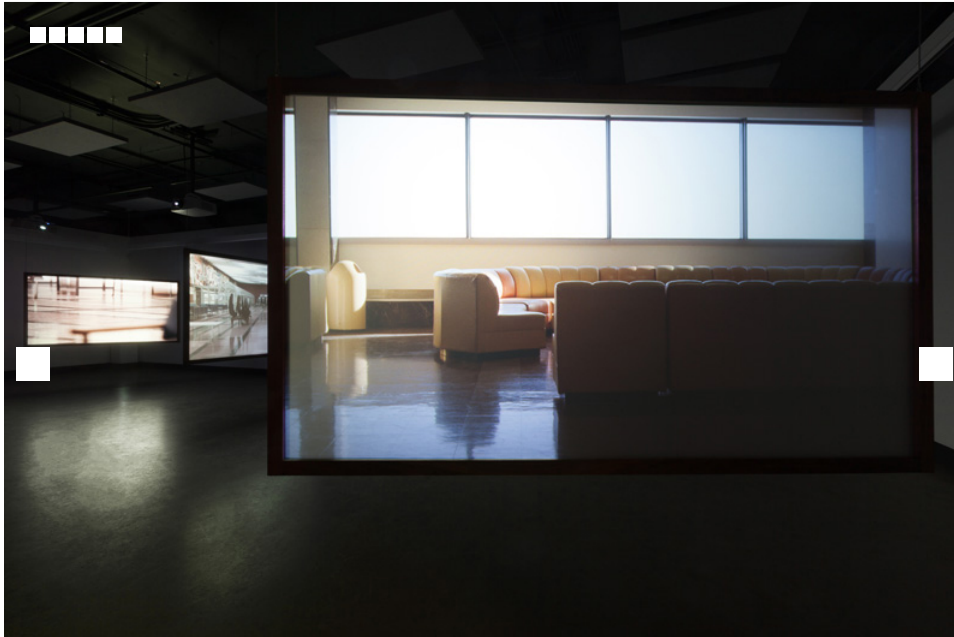
Myriam Yates, Gander Terminal , 2017, vue d'exposition/exhibition view, triptyque vidéo/video triptych.

Étiquettes : Critiques d'expositions | Auteurs : Sylvain Campeau | Artistes : Myriam Yates