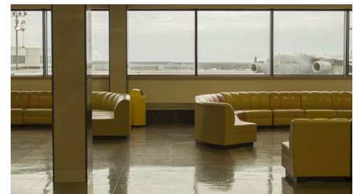
© Myriam Yates, Gander Terminal (2017).

Bush, a commissioned mural by the Canadian painter Kenneth Lochhead and a terrazzo floor with motifs reminiscent of Mondrian. These very strategic aesthetic choices contribute to presenting a progressive image of Canada to travellers in transit—for whom, in most cases, the airport would be their only contact with the country. However, this refuelling stopover necessary for intercontinental flights quickly became obsolete thanks to the rapid progress made in aeronautics. Today the imposing lounge in the international area is practically deserted; only the American armed forces and a few dignitaries flying on private airplanes pass through it on occasion. In a series of fixed shots and brief tracking shots playing in a loop on three large screens suspended in the gallery space, Myriam Yates dissects this incongruous space and, in the slow unfolding of the images, lets the history of the site enter into them. A second work, shown on two monitors, attests to the furtive presence of American soldiers in transit who, breaking the site's