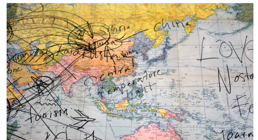
© Hillside Projects, Map of Migration (2016).

The work of Hubert Caron-Guay, which grows out of the proximity, one might even say the intimacy, he develops with his protagonists, explores first and foremost the human condition, even as the policies governing this condition are interrogated. The work presented here, Arroyos —which translates to “flows”—offers a disquieting portrait of the corridor taken by many migrants at the border of Mexico and the United States and the people who find themselves confined there. The work’s large-screen projection shows landscapes that convey the loss of bearings, the scale of the crossing and the inherent insecurity of the migrants’ journey. Adjacent to the projection is a series of intimate portraits for view on mobile telephones. The vastness of the crossing is confronted with the details of individual dramas in which barriers and borders carry out a form of repression that goes